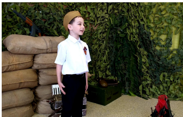
«Сяду к деду на колени»